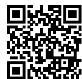
連絡メール2 保護者ログイン

学校・お子様の追加やその他登録内容を変更する場合 右記の「保護者ログイン用二次元コード」を読み取り、保護者サイトに接続します。 * その際、登録したメールアドレスとログインパスワードを入力します。 * 保護者サイト https://renraku.education.ne.jp/parent/ パスワードを忘れた場合 上記登録と同様に空メールを送信すると、パスワードの再設定ができます。 * 保護者登録しているメールアドレスがご利用できない場合は、パスワードの再設定ができません。