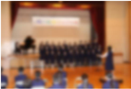
【「夢を追いかけて」1年1組】