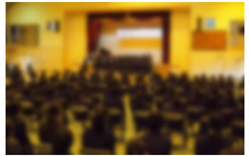
合唱コンクールを実施しました。どの学級 も心に響くハーモニーを作り上げました。