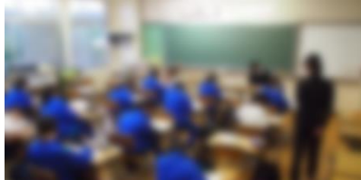
学習支援員を新たに導入し 放課後学習教室を始めました