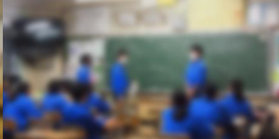
後期の生徒会活動が始まり 取組について話し合いました