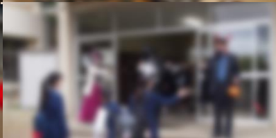
月末の「ハロウィン」の朝は 登校時から笑顔が溢れました