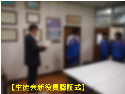
【生徒会新役員認証式】