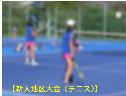
【新人地区大会（テニス）】